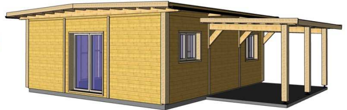
Galerie Long Pan toujours sur 2 trames Profondeur 3m