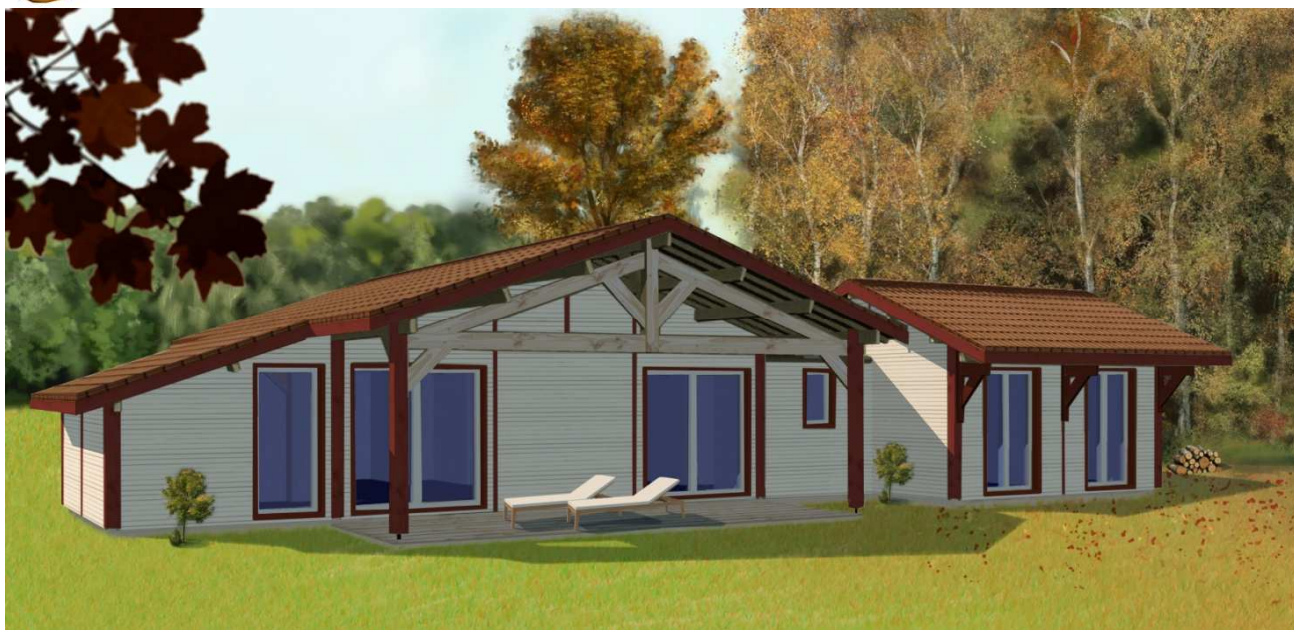
Structure poteaux-poutres, Panneaux nus prêts à barder + Charpente traditionnelle (hors tuiles et dalle béton)

MME-75 + Options : Galerie Pignon GP-753 & Agrandissement AG-2T/20