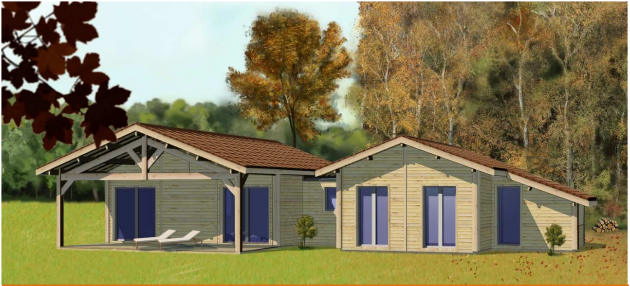
Structure poteaux-poutres, Panneaux nus prêts à barder + Charpente traditionnelle (hors tuiles et dalle béton)